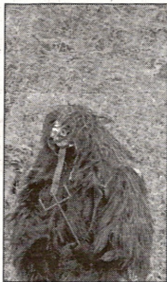
Tufara, e a destra la maschera del diavolo

cultato. Intanto fervono in paese anche i preparativi per il martedì grasso, quando il "Diavolo" si esibirà per l'ultima volta nel corso di questa stagione carnevalesca prima dell'arrivo della Quaresima, con l'auspicio che questa volta anche le condizioni meteorologiche siano propizie.